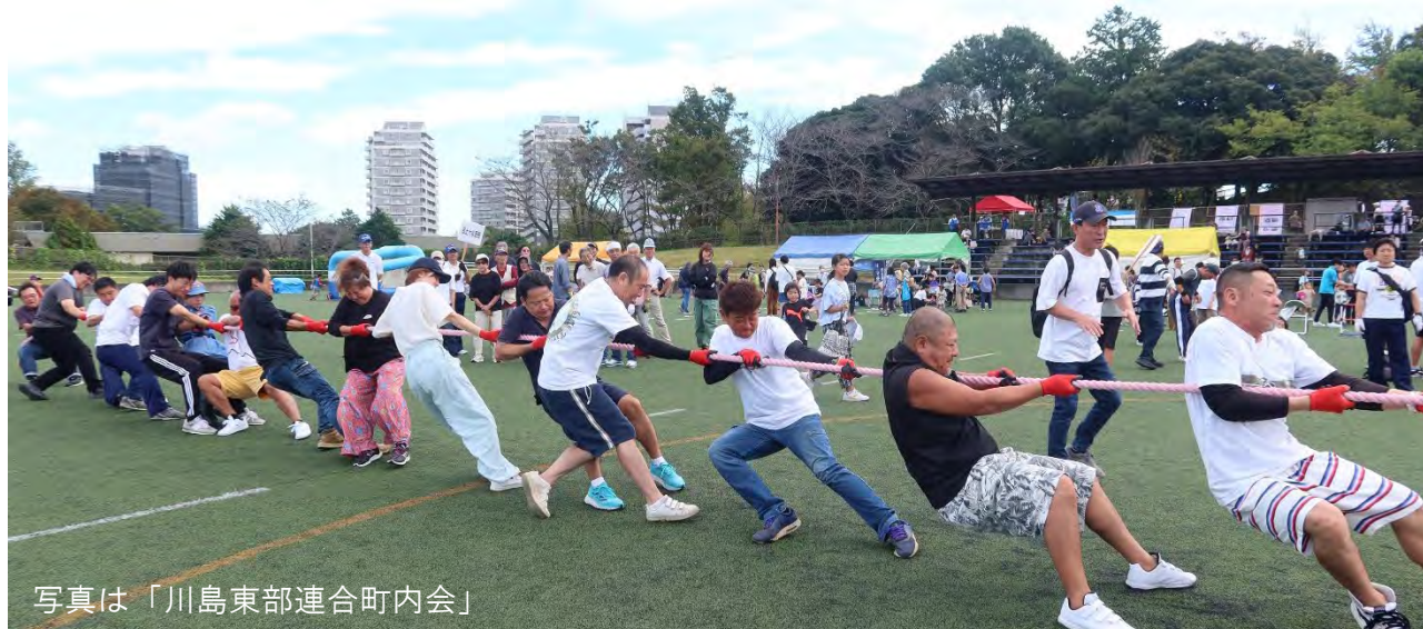
写真は「川島東部連合町内会」

優勝「中央連合町内会」、2位「川島東部連合町内会」、3位「保土ヶ谷西部連合自治会」