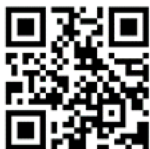
一般廃棄物処理基本計画（素案） リーフレットデータ