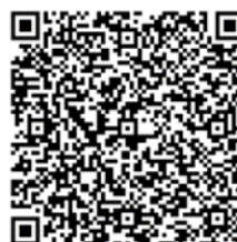
電子申請・届出システム