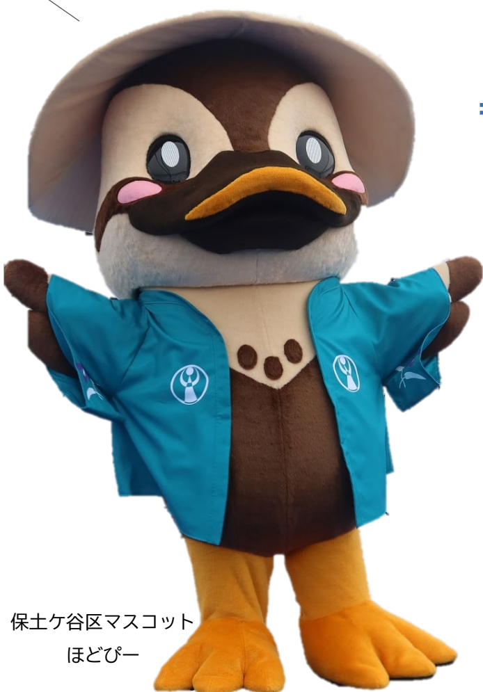
保土ケ谷区マスコット ほどぴー