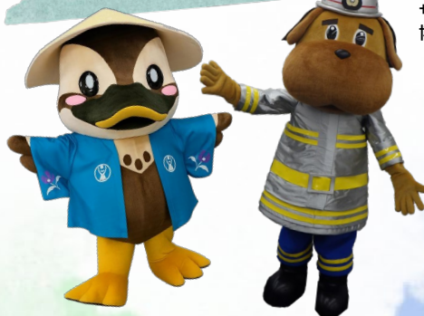
保土ヶ谷区マスコット ほどびー